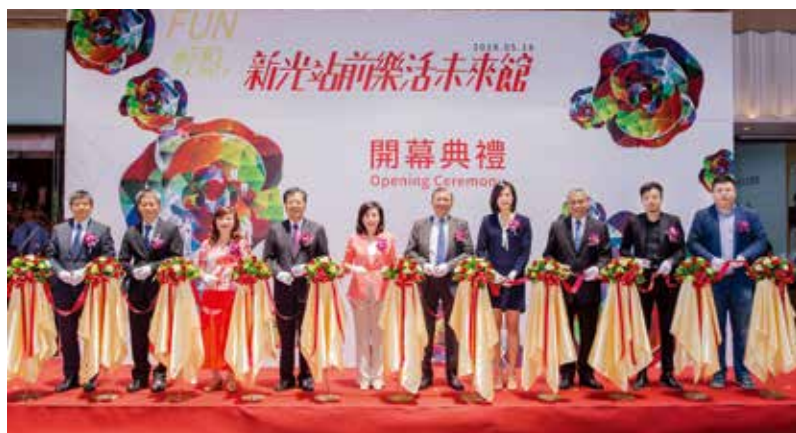
新光站前樂活未來館盛大開幕，眾多貴賓出席剪綵，儀式盛大隆重。

新光人壽以「光無所不在，心與你同在」為企業精神，未來將持續以貼心、多元、整合為基礎，結合社會趨勢與新科技，提供客戶優質完善的全方位服務。