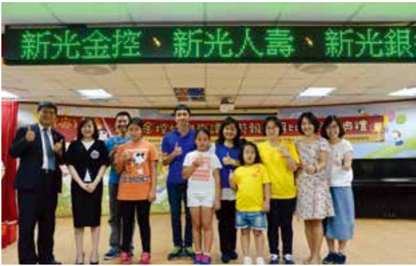
特優組 低中 高年級