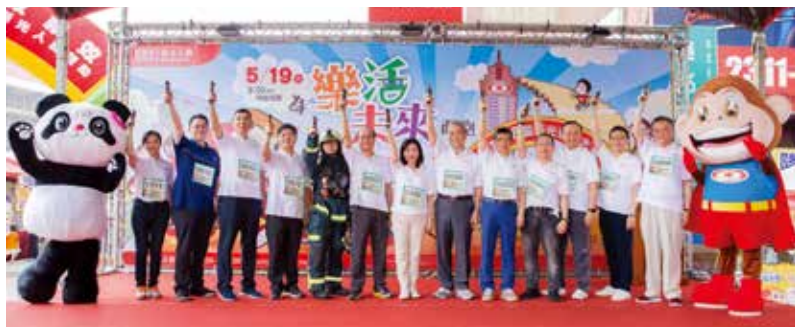
第 36 屆新光摩天大樓登高大賽「為樂活未來而跑」，19 日上午八時，準時鳴槍起跑，並將成為國內第一個導入「ISO 20121 永續活動管理系統」的登高賽事，落實企業社會責任。

本次登高公益活動，提供價值近五百元的豐富完賽禮給所有參賽者，除了有舒酸定牙膏、白蘭氏雞精、及半天水椰子水的大力支持，路易莎咖啡也提供完賽者每人 2 包公平貿易掛耳式咖啡包。此外，登高大賽也抽出由中華航空及長榮航空贊助的台北曼谷、台北清邁來回機票、iPhone X、健檢券、刷卡金等價值超過百萬元以上、700 多項好禮，讓報名者做公益又可抽大獎。登高大賽成績排行榜、樂透大摸彩中獎名單及領獎作業，於 5 月 21 日(一)起在新光登高大賽 ( https://active.skl.com.tw/Runup/ ) 公佈。