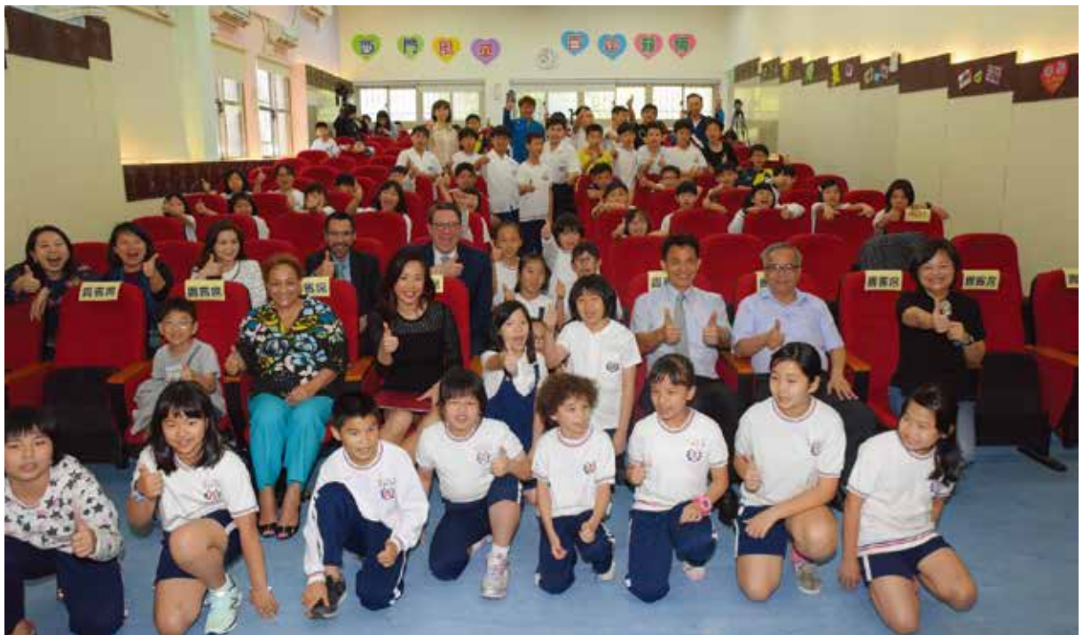
活化歷史活動在西門國小示範場大合照

新光人壽慈善基金會與果陀劇場合作的活化歷史校園示範場 4 月 26 日 (四) 在台北市西門國小分享爺奶的童年故事，此次活動邀請到美國