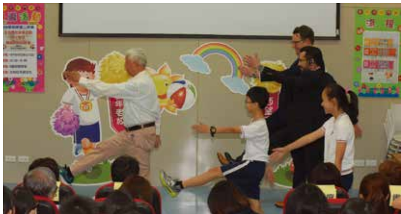
西門國小校友旺伯 (左一) 教孩童們及 AARP 貴賓 (右二及右三) 踢正步

「祖孫牽手·玩美城鄉—30 家鄉認養活動」將用地方的力量，使用地方的素材，回饋給地方。每當一地的捐款達到設定的目標，由活化歷史團隊啟動規劃，從長者課程到與孩子互動，最後會由專業帶領人指導長者與孩子，共同完成一齣戲劇呈現，並在當地公開表演。