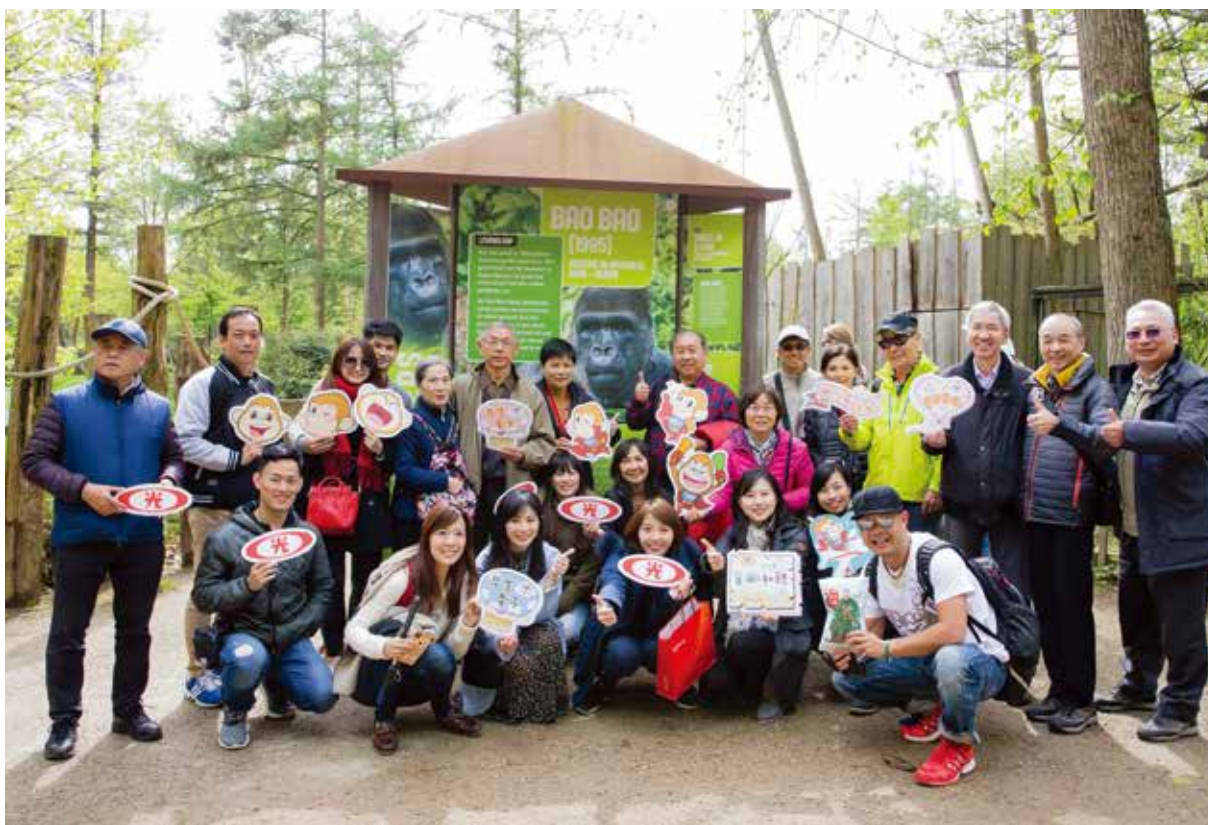
新光「荷蘭文化歷史探親團」親自前往荷蘭「阿培浩爾動物園」送上早生貴子的祝福。