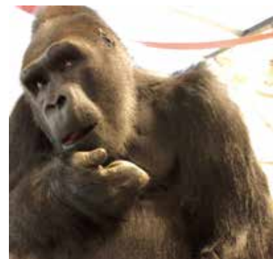
寶寶見到新光「荷蘭文化歷史探親團」的團員們，熱情的以手勢回應，以表開心。

寶寶2歲來台，至今33年都是黃金單身漢，為實現寶寶的最後一個願望及為讓他珍貴的基因多樣性繼續傳承下去，台北動物園歷經多年與國際保育計劃整合，終於獲得「歐洲金剛猩猩瀕危物種保育計劃（Gorilla EEP）」委員會的認可與協助，爭取到以最優勢雄性金剛猩猩身分建立繁殖群的機會，讓「寶寶」加入歐洲照養金剛猩猩數量眾多的荷蘭「Apenheul Primate Park（靈長類公園）」，並進行繁衍重責，為瀕危的金剛猩猩族群注入新血。