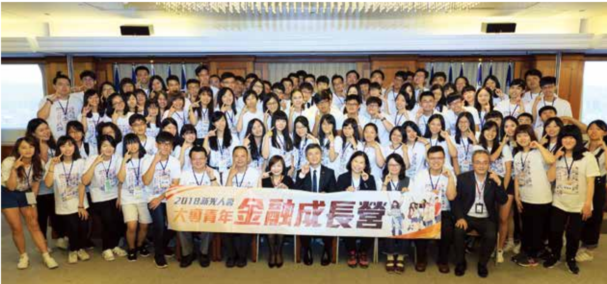
2018 新光大專青年金融成長營，透過多元豐富的課程，鼓勵大學生追求人生多面向的平衡與個體潛能的探索。

為推廣金融保險教育，呼應全球崛起的無邊界職涯「斜槓青年」時代趨勢，新光人壽於7月9日（一）至7月12日（四）在台北劍潭青年活動中心共同舉辦為期四天三夜的「2018 新光大專青年金融成長