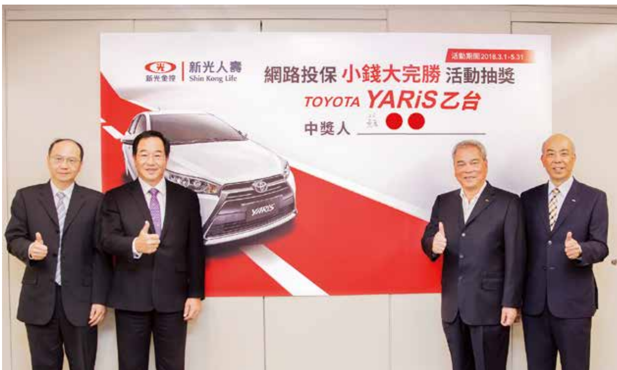
新光人壽網路投保《小錢大完勝》活動於 6/14 正式抽出得獎者。

新光人壽網路投保於 3 月推出「Up Cash 利率變動型年金保險【乙型】」，搭配首期保費滿額抽名車活動，上市第一個月就讓業績翻漲百倍以上！活動推出三個月創造保費