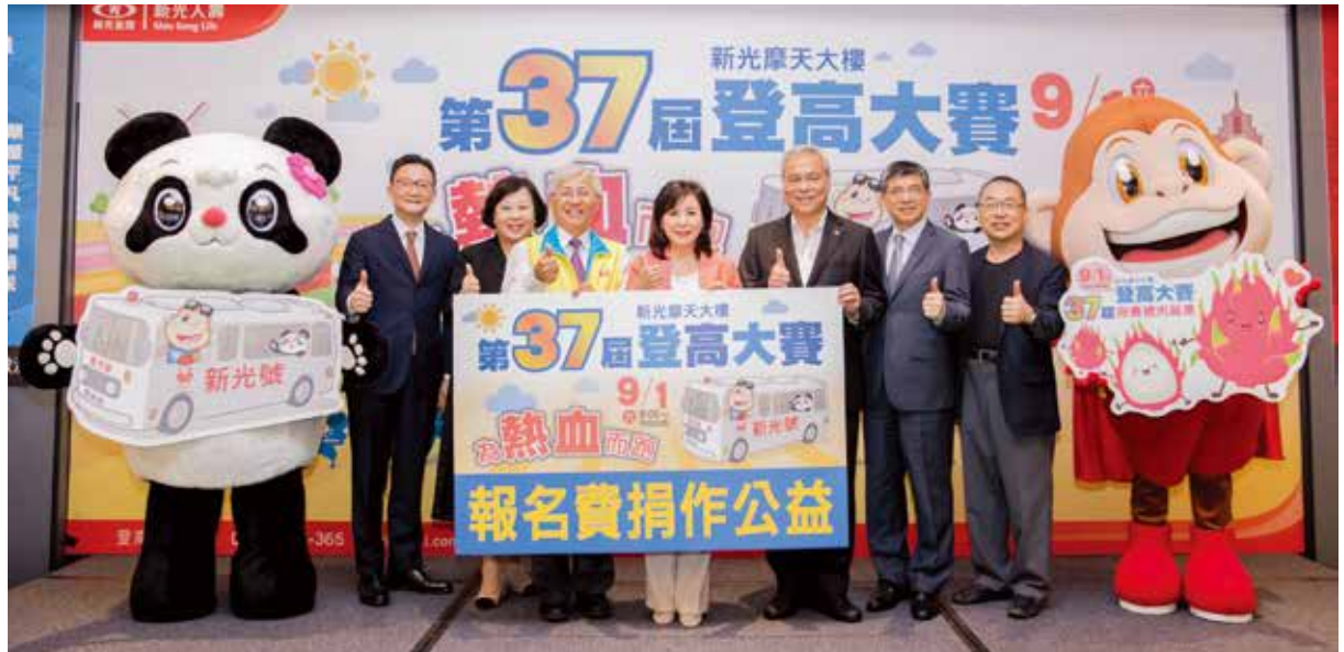
第 37 屆登高活動報名費將用以購入 4.0 版捐血車，不足額部分由新壽全數補足，並捐贈給台灣血液基金會。