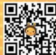
元富理財「小資零股」APP