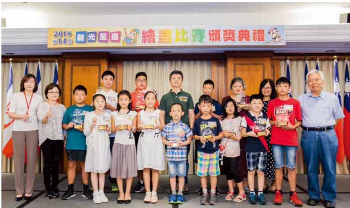
第 14 屆新光全國繪畫比賽頒獎典禮，用藝術交流實現跨世代共樂共融的情感。

2018 年度畫壇盛事，由新光人壽與新光銀行共同主辦的「第十四屆新光全國繪畫比賽」，逾 13000 件作品報名參賽，參賽畫作各自精彩，高水