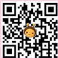
元富i理財「小資零股」APP