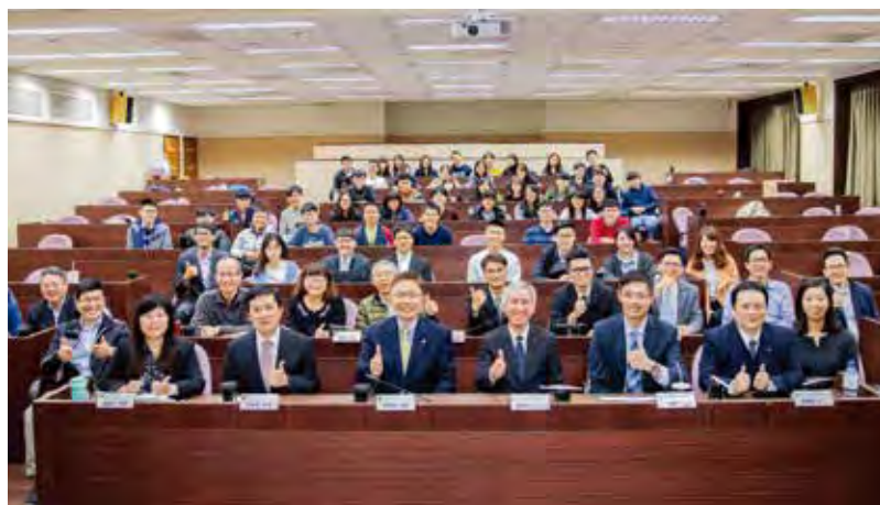
新光人壽長官與中央大學師生們於簽署產學合作備忘錄後，一同合影留念。

新光人壽強調，企業需秉持永續經營理念，不論照顧員工、培養人才、提升產業競爭力等都是企業責任，中央大學一向辦學績優，根據「美國新聞與世界報導」公佈之2019年全球最佳大學排名，名列台灣第四，且科系領域與新光人壽企業經營所需的人才媒合度很高，未來與中央大學合作相信會有很好的成果。