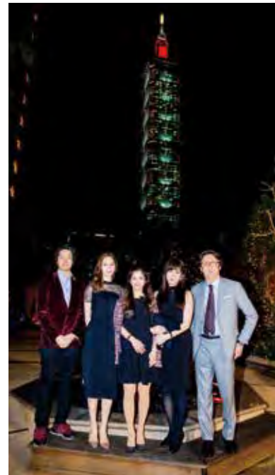
日本 JPCO 女子樂團來台下榻新光信義傑仕堡，遠眺 101 大樓

「秋深猶有蝶飛來」~ 與 JPCO 藝術家們餐敘的鼎泰豐牆上，懸著這幅畫，畫裡這句「秋深猶有蝶飛來」，一面點出季節，一面預告了佳人再來，風華正好。眼前這幾位翩翩來到的日本藝術家，帶來是精緻藝術的美好，更是跨海而來的情誼，一樣對未來深具信心，一樣珍惜美好緣分。