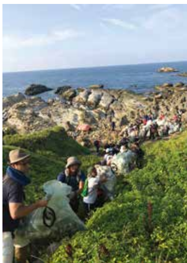
團結力量大，大家以接龍方式將垃圾運至路邊。

時序進入夏季，身為海島的台灣有著美麗的海景，各地充滿大批人潮從事各式水上活動。但曾幾何時，號稱福爾摩沙的台灣海岸線，美麗光環逐漸退去，取而代之的是大量的海洋廢棄物。根據荒野保護協會統計歷年淨灘成果，台灣海岸線被 180 萬噸的垃圾環繞，平均每公尺就有 0.7 公斤的海洋垃圾。世界經濟論壇研究更