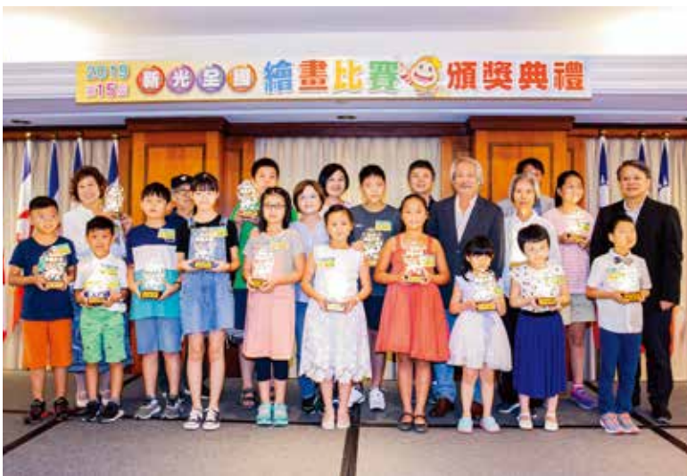
第十五屆新光全國繪畫比賽頒獎典禮，上百位得獎者及家長共襄盛舉。

良好的社會風氣讓藝術得以繁榮，新光全國繪畫比賽開辦至今已十五屆，每年都吸引許多親子響應，而良好的環境是全民共同的責任，新光人壽以「光無所不在，心與你同在」的企業精神，化行動為力量，藉由繪畫傳達企業關懷在地、愛護家園的期待，將環保觀念向下扎根，讓大小畫家們用藝術為橋樑，和自然環境連結在一起，帶領下一代建構出美好未來的畫面。