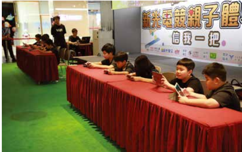
新光盃讓孩子化身為電競選手，實際體驗比賽的緊張感。

孩雙排或對抗，解鎖「親子完成三場遊戲」的每日任務。雖然有許多家長不曾玩過《傳說對決》，為了替孩子贏得任務獎品仍努力嘗試，營隊因此頓時出現許多「小孩教導大人」的有趣畫面。