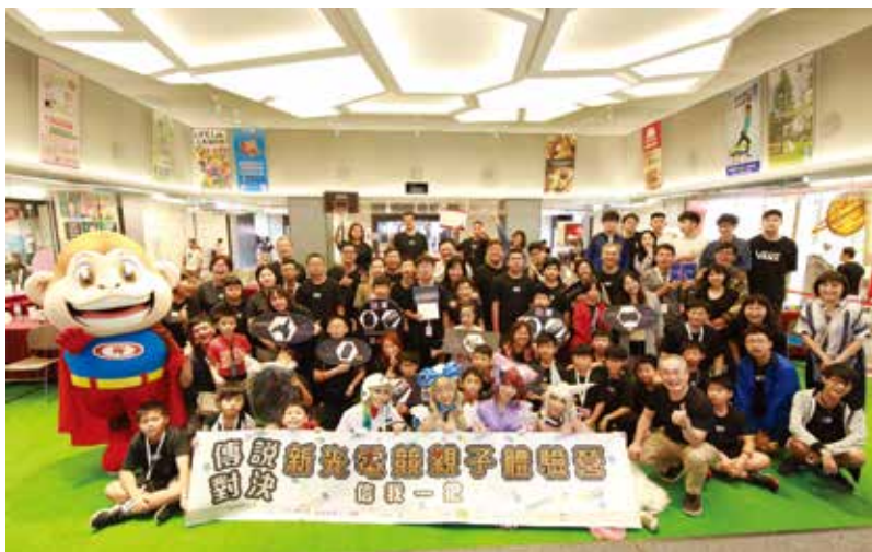
為期兩天的營隊圓滿落幕，學員皆感到意猶未盡。

營隊針對親子的需求設計不同內容，專為家長設計的橋段，著重在解決親子交流的難題，像是如何與孩子建立遊戲規範、如何引導孩子在遊戲中磨練腦力；給孩子的課程，則