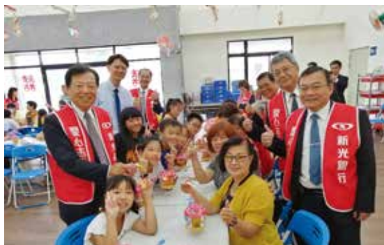
新光銀行李增昌董事長 (左 1) 帶領屏東地區同仁與大小朋友一起折製鼠年燈籠

11/1(五)起至 2020/1/31(五)止，使用新光銀行 App 或網路銀行跨行轉帳，累計 4 筆即可兌換一個鼠年幸運提燈；新光銀行信用卡卡友，當月刷卡累計一般消費達 10,000 元，可兌換五個。此外，8/1 起新申辦新光銀行新光三越聯名卡，於活動期間刷卡單筆一般消費滿 2,000 元，也可兌換一個。歡迎民眾踴躍兌換，與家人共享創作的喜悅與樂趣，詳情請見活動網頁 https://ppt.cc/fyWEux