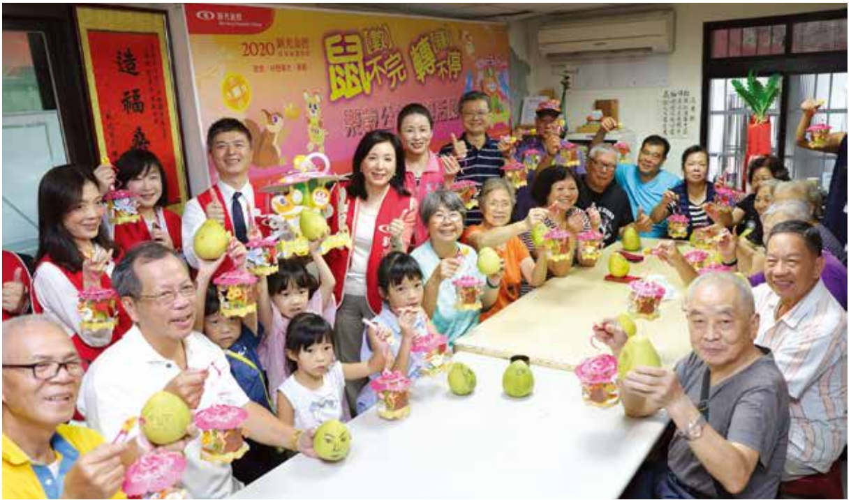
2019 新光樂齡公益關懷活動，伴銀髮族樂活過中秋。

隨著人口急速老化，患有失智症的人口也明顯增加，新光金控近年致力推動社區陪伴關懷活動，鼓勵銀髮長者開創健康樂活人生，「2019 樂齡公益關懷活動」就在9月國際失智症月正式啓動。自9/9(