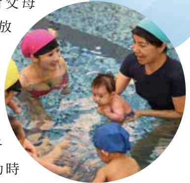
水獺老師親自示範嬰幼兒水中律動

落水後像爬沙發一樣轉身爬上岸的動作，不僅幫助寶寶建立在水中的自信、強化寶寶肌肉骨骼與平衡感、協調性之發展外，同時可讓父母和寶寶一同享受水中的樂趣、增進互信及親密感。對父母而言，也釋放了壓力，與寶寶一同放鬆，彼此創造共同體驗的親子樂趣與互動時光。