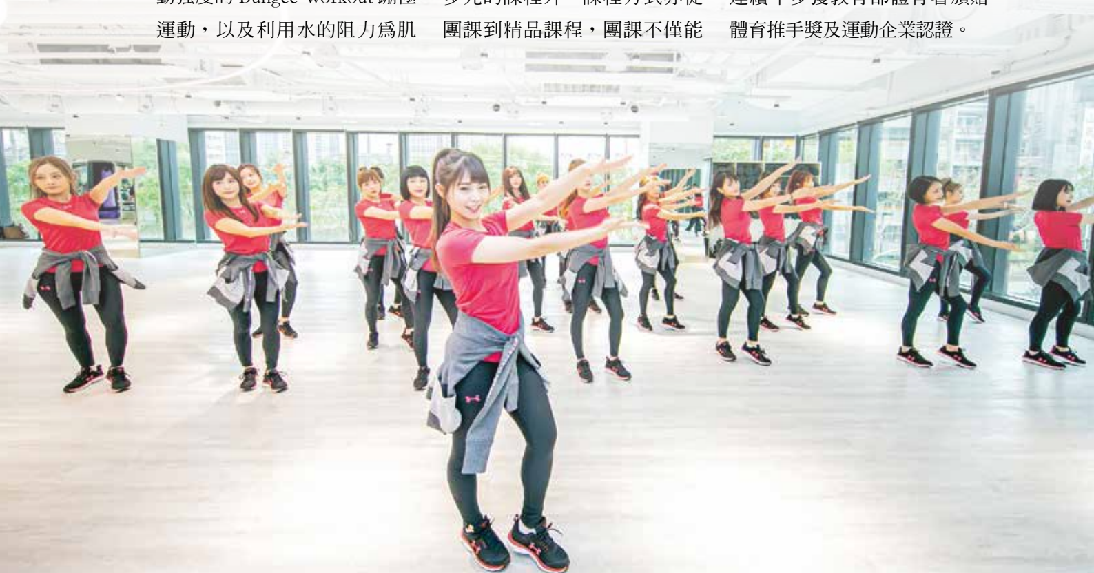
Rakuten Girls 於新板傑仕堡 JX 健身俱樂部展開春訓，賣力展現全新的應援舞蹈。

為促進全齡健康，鼓勵全民運動，新光人壽不僅從預防醫療的角度推出業界首創結合健身房的外溢保單「活力健身重大傷病定期保險」，鼓勵保戶持續運動，就有機會享保費折扣保險商品外，亦透過自辦「新光摩天大樓登高大賽」、「新光盃熱門街舞大賽」及贊助日月潭泳渡、田中馬拉松、中華職棒等種體育活動，提倡全民運動，活出健康人生，也因而連續年多獲教育部體育署頒贈體育推手獎及運動企業認證。