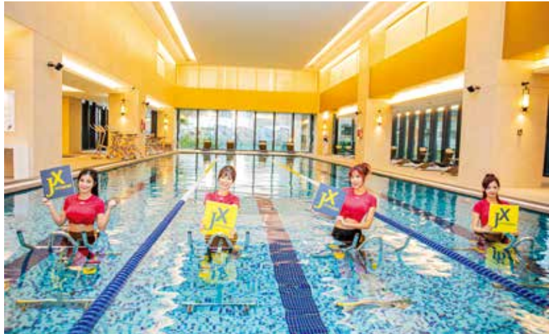
Rakuten Girls 參與水中腳踏車課程後大為讚嘆。

新冠肺炎 (COVID-19) 疫情延燒，新光人壽關心全民健康，於 2 月 27 日特別提供新壽新板傑仕堡 B 棟 JX 健身俱樂部作為 Rakuten Girls 春訓開訓場地，並提醒大眾預防新冠肺炎除勤洗手、帶口罩外，更別忘多運動，提升自身免疫力，以對抗病毒。開訓現場，JX 健身俱樂部 Zumba 老師與 Rakuten Girls 以動感熱舞暖身為開訓儀式揭開序幕，然後展開新舞步、應援曲排練並體驗全台唯