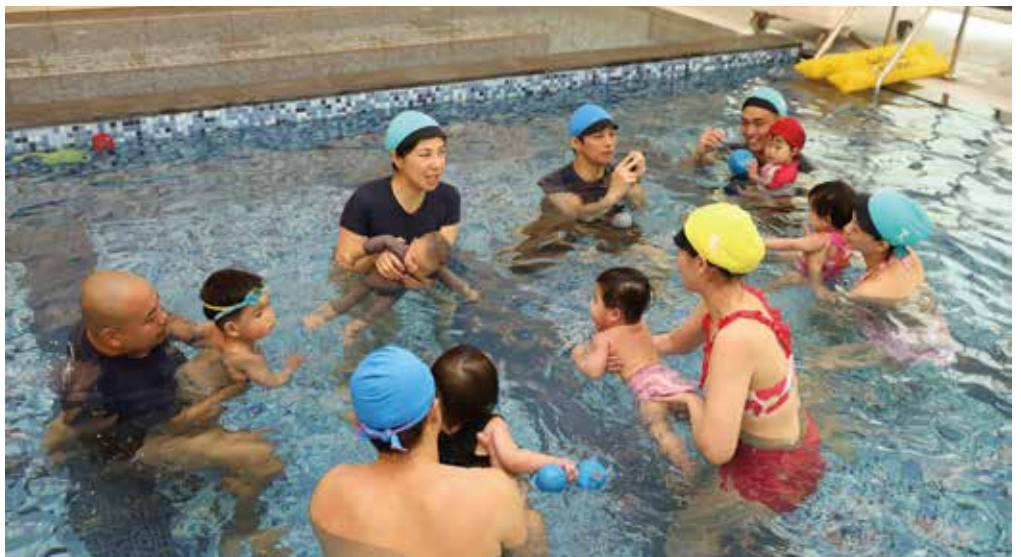
水獺老師帶領爸媽們了解如何讓寶貝體驗水中運動樂趣