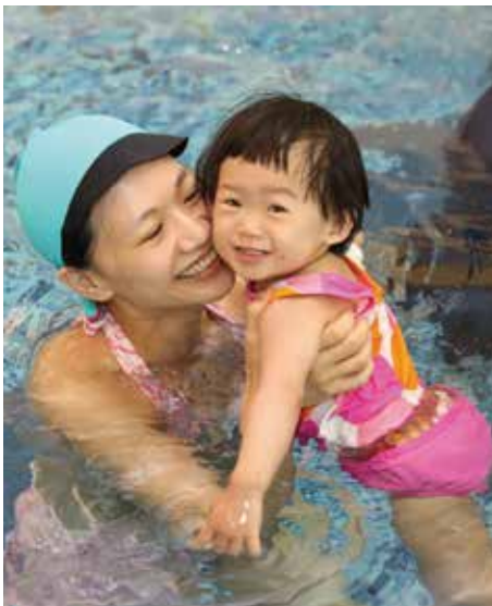
媽咪與寶貝一起水中遊增進親子感情