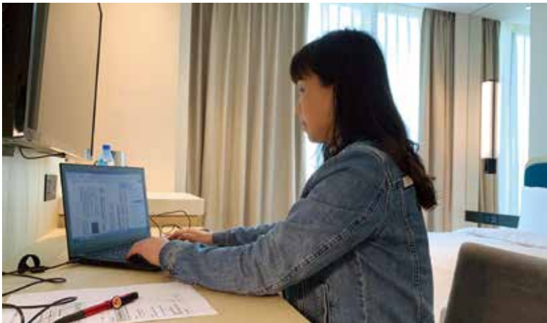
新光金控員工於新板傑仕堡商務旅館演練居家辦公

國內金融業日前出現首例確診病例，新光金控表示，自1月底起即已暫停所有員工海外出差行程，新光醫院更早在1月23日武漢封城隔天，1月24日就由侯勝茂院長（前衛生署長）通令醫護人員不准出國。新光關係機構也早於多年前，即規範所有關係機構管理階層，不論公務或私人旅遊，出國行程皆需事先報備且經核可，並建立好代理人制度。近期國內確診個案多為境外移入，新光金控也宣布，強烈呼籲所有同仁支持政府防疫政策，取消出國旅遊行程，以確保個人及家人健康及安全，未