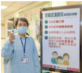
針對體溫異常者由醫院同仁協助再次確認