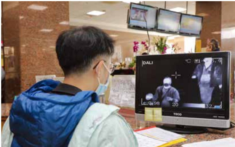
新光醫院於一樓大廳出入口設置紅外線體溫量測儀，希望將防疫工作做到滴水不漏

台灣已出現部分感染新冠病毒肺炎個案，並沒有出國旅遊史，惟因為受到外來的帶原者的傳染，經接觸後再傳給旁邊的人，所以可以說 COVID-19 病毒已經有限度地進入我們的社區，但尚沒有大幅的社區傳播。在社區中受到感染的人，症狀輕一點可能自己服一點抗感冒藥就可自行痊癒，但症狀重一點就會到醫院、診所就診，所以我們第一線醫療人員便是最重要的把關者，我們可以做到以下幾點：