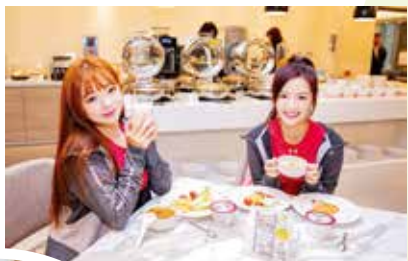
Rakuten Girls 享用美味早餐