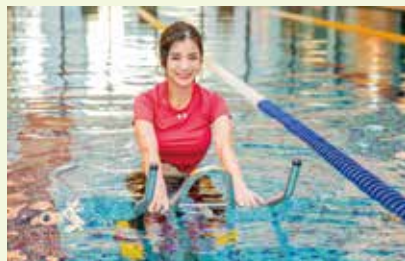
羚小鹿於 JX 健身俱樂部體驗水中飛輪