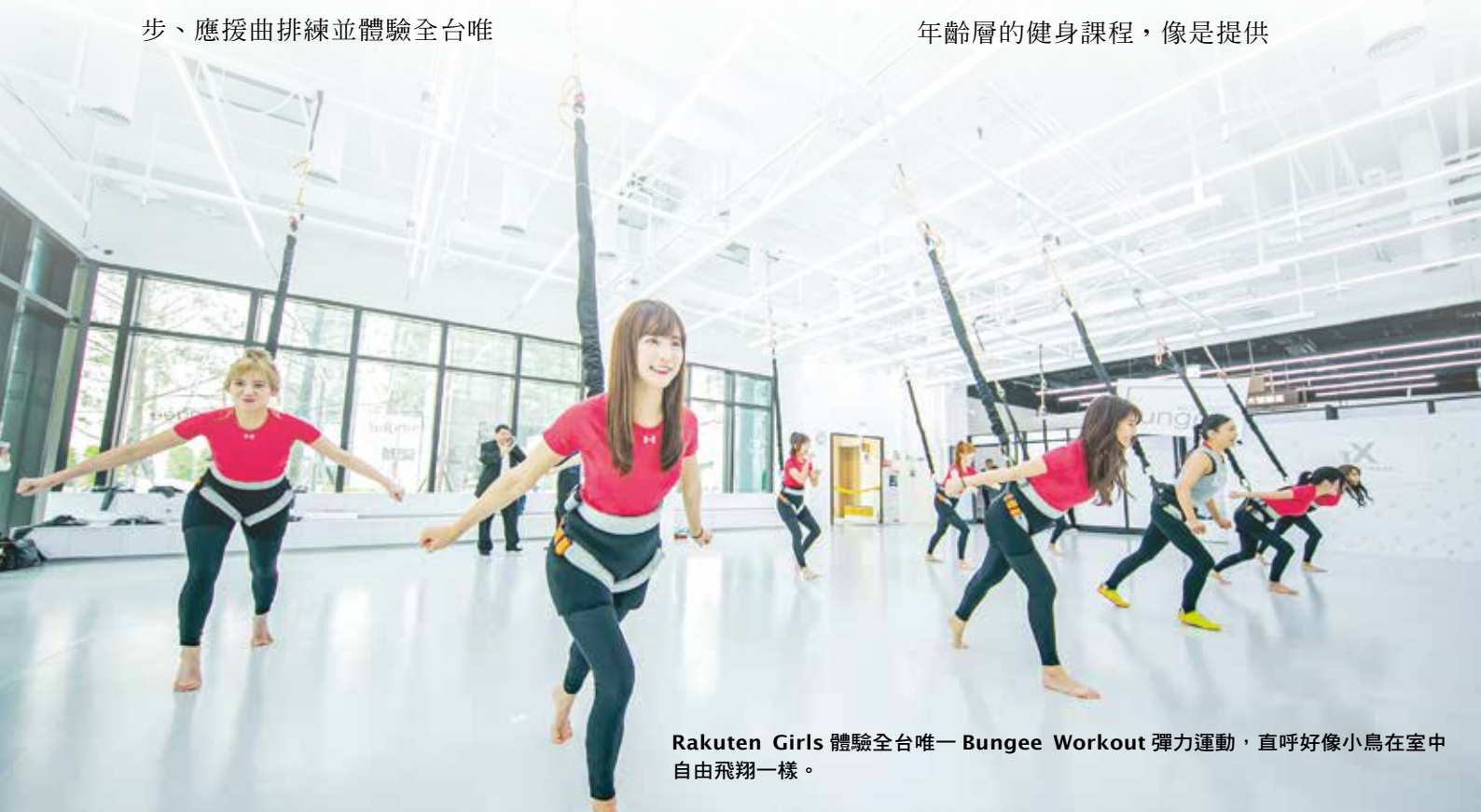
Rakuten Girls 體驗全台唯一 Bungee Workout 彈力運動，直呼好像小鳥在室中自由飛翔一樣。

新板傑仕堡 B 棟 JX 健身俱樂部佔地 1,500 坪，為新北市最大的健身俱樂部，規劃滿足各年齡層的健身課程，像是提供