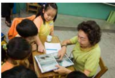
曾有長者開心地表示，原來過往的生命故事孩子那麼有興趣，自己沒有白活了。

https://www.facebook.com/Elder.History.Alive