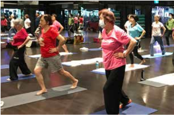
銀髮防弱肌健身課程中，用小角度的運動方式訓練，提升長輩身體穩定度、平衡度。