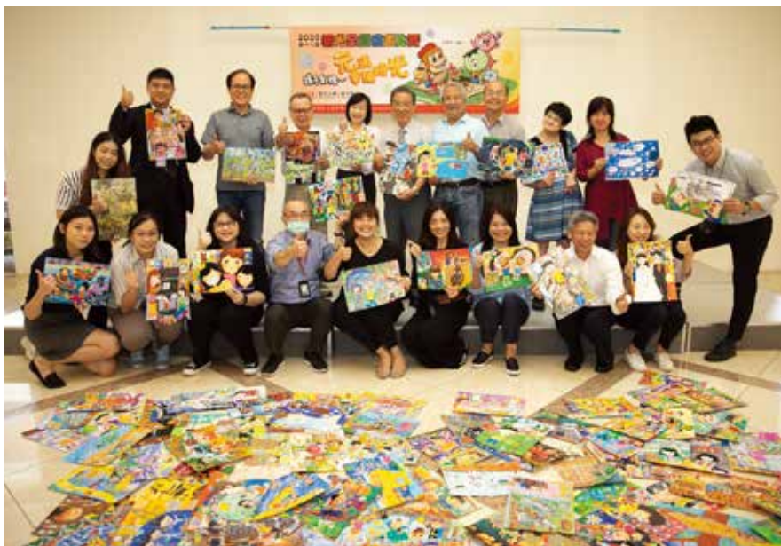
第十六屆新光繪畫比賽收到超過 15,000 件參賽作品，報名創新高。

新光全國繪畫比賽開辦至今已邁入第十六屆，每年都吸引許多親子響應，2020 年是歷史上重要的一年，疫情席捲全球，讓民眾更珍惜與親友相聚的時刻，在如此特別的時空背景下舉辦，希望透過活動重視陪伴的價值，創造最快樂幸福的時光。本屆也首度與知名插畫家「8 元哥」攜手合作，每收到一件參賽作品，就回饋 8 元為偏鄉學校購置圖書，把民眾參與的熱情轉化為資源，為偏鄉教育創造正向循環，以「光無所不在，心與你同在」的溫暖精神點亮偏鄉，陪伴學童創造無限可能的未來。