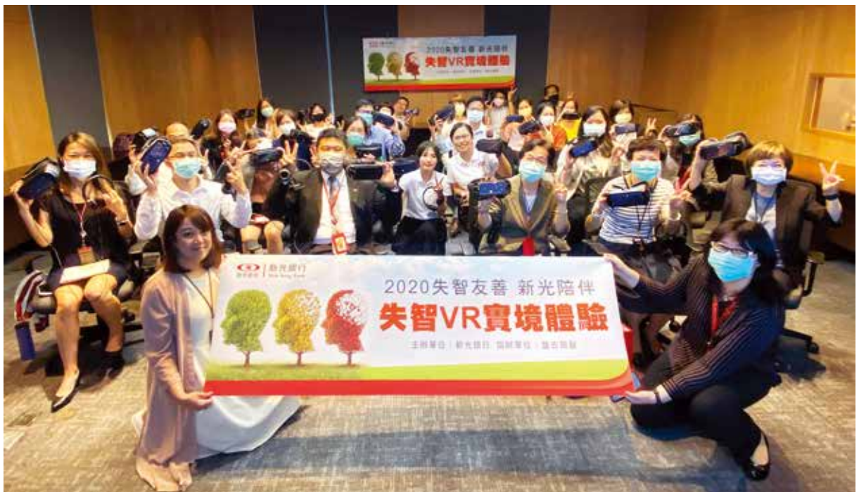
新光銀行舉辦多場失智 VR 實境體驗活動，邀請內部主管及同仁與一般民眾共同參與體驗，傳達失智同理心營造。

新光銀行長期關注台灣高齡化社會的脈動，近年來秉持「失智友善·新光陪伴」精神，投入大量資源，致力於失智友善的社會氛圍營造、推動失智同理之各項行動計劃，2019年與「台灣失智症協會」合作，成為全台首家「失智友善銀行」；2020年持續推動本計劃，並創新結合科技VR