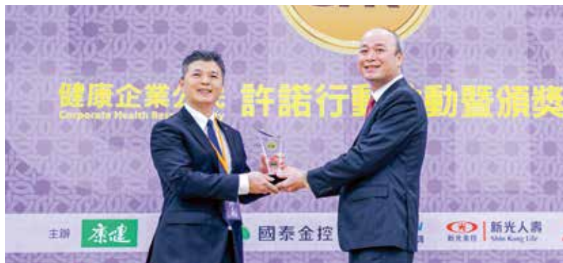
新光人壽榮獲「CHR 健康企業公民」銀獎

在員工心理健康層面，新光人壽除了過去既有的外部 EAP（員工協助方案）服務模式，也聘任具備企業經驗的專任心理師，並規劃系統性的心理健康促進計畫「從心出發，打造員工有感服務」，也是目前國內企業少見、更是金融保險業首創的整合式服務，服務涵蓋心理健康講座與教育訓練、職場暴力預防、內部心理諮詢、心理課程開發等面向，同時培訓對助人有興趣的員工，相信透過用心關懷的服務，能提升員工對公司的歸屬感，進而樂在工作。