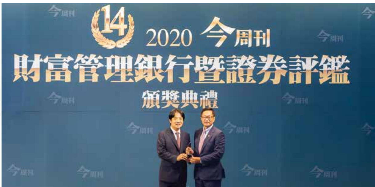
元富證券獲頒最佳財富管理券商獎特優，由副總統賴清德（左）頒發獎座，元富證券總經理李明輝代表受獎。

在疫情震盪下，面對市場大幅動盪，元富證券將眼光放遠，守護客戶的財富成長。秉持專業，針對客戶偏好及屬性，打造客製化理財商品，對於架上商品嚴格把關與時時刻刻檢視風險，超前佈局，提供客戶即時有效的示警，依據客戶風險承受能力，有效提出調整規劃建議。元富用心經營客戶關係，將客戶滿意放在第一，未來會更加用心、更具創新地提供超越客戶期望的高附加價值金融服務，永續並增長客戶的財富。