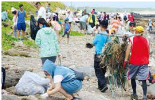
新光人壽慈善基金會積極投入環境保育—撿獲大量廢棄漁網及垃圾。