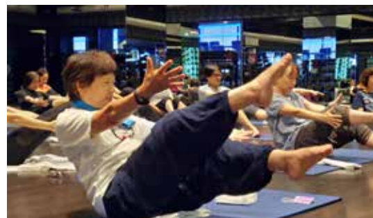
老師也會帶一些具挑戰性的動作，奶奶們盡力地達成，同時獲得成就感。

https://www.facebook.com/Elder.History.Alive