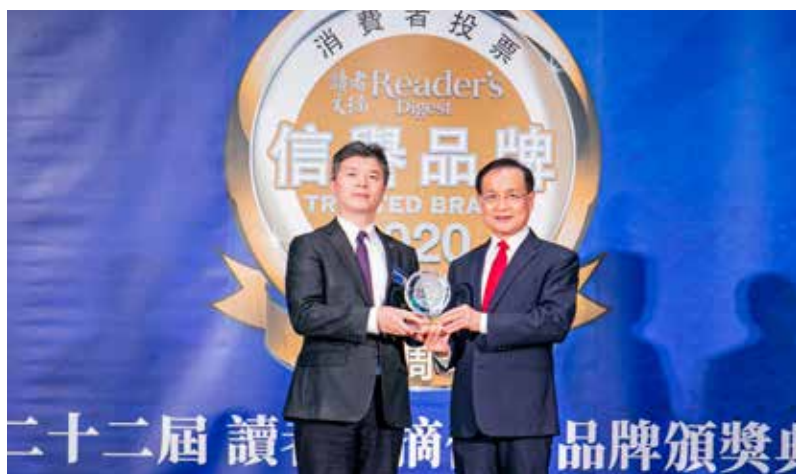
新壽獲讀者文摘「信譽品牌獎」金獎

「讀者文摘信譽品牌」從 1998 年開始每年在全球五大洲、三十個國家進行市場調查，今年委由全球知名消費者研究公司 Catalyst Research 調查，發掘亞洲最值得信賴的品牌，總共有 8,000 位受訪者，來自調查區域的 5 大市場，包括：台灣、香港、菲律賓、新加坡、馬來西亞。受訪者依照對品牌的信賴程度、品質、價值、了解消費者需要、創新與社會責任等六項標準作為評分依據。