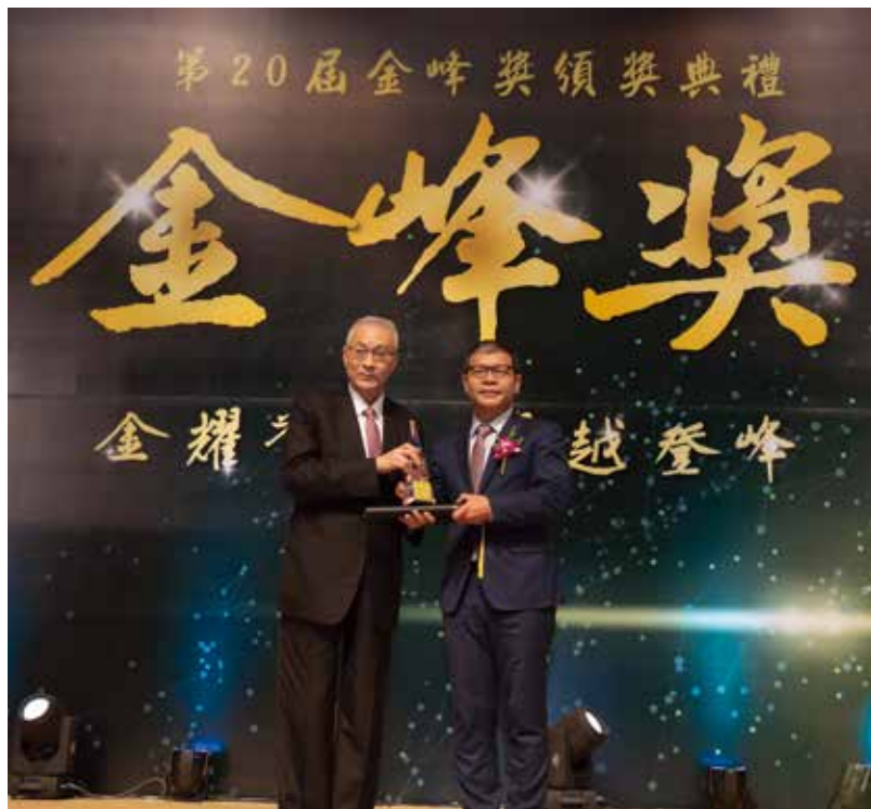
前副總統吳敦義 (左) 頒發獎座，元富證券電子商務部資深協理郭志聰 (右) 代表受獎。

郭志聰資深協理表示，元富證券積極推動及發展行動理財服務，期盼滿足投資人更多理財需求。未來也將持續精進數位金融科技服務並投入相關資源，滿足多元投資需求，為投資人打造理財最佳利器，朝全方位數位券商邁進。