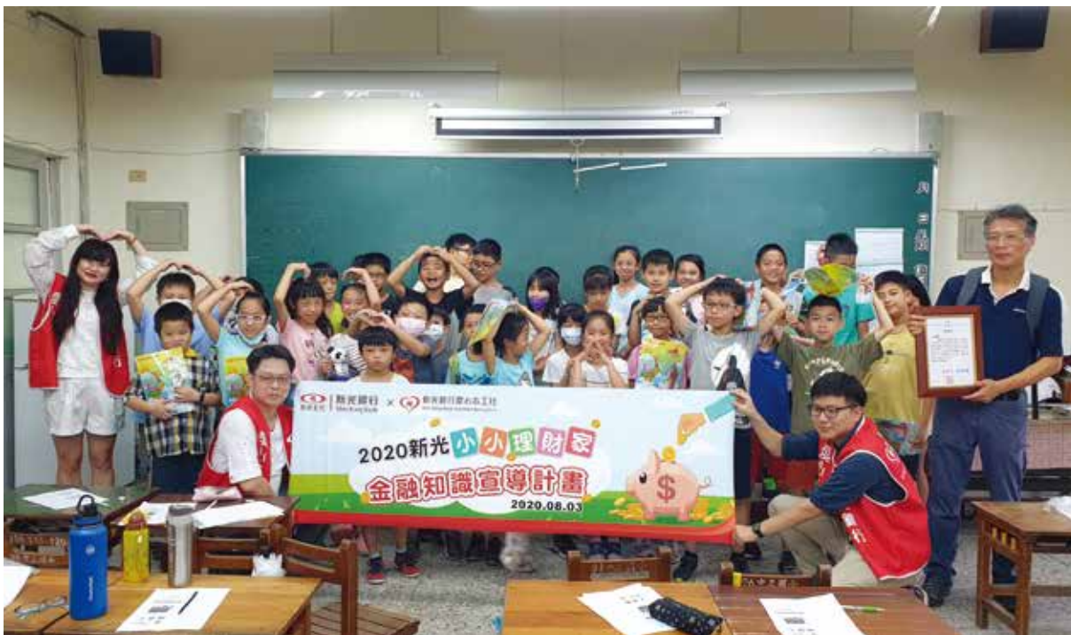
新光銀行小小理財家前往偏鄉為弱勢學童宣導理財知識教育

新光銀行運用職能專業及整合集團資源，為偏鄉及弱勢學童帶來更多學習機會及正向人生觀，期許在孩童心中種下愛的種子，建立良善氛圍的循環，以傳達「光無所不在，心與你同在」的企業精神，實現社會公益的核心價值。