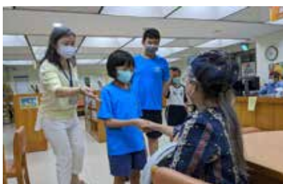
帶領人綠豆老師在校園中，引導孩子牽起長輩的手，建立起跨世代的交流與互動。