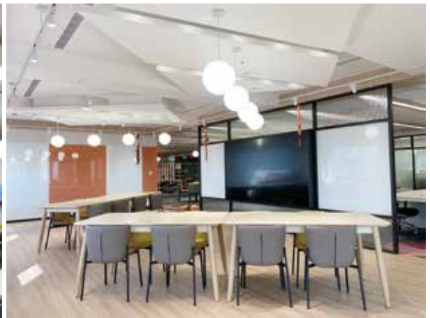
SPARK HUB 為數位數據暨科技發展團隊的研發中心，也是金控與子公司間交流、協作與創意競賽的平台。