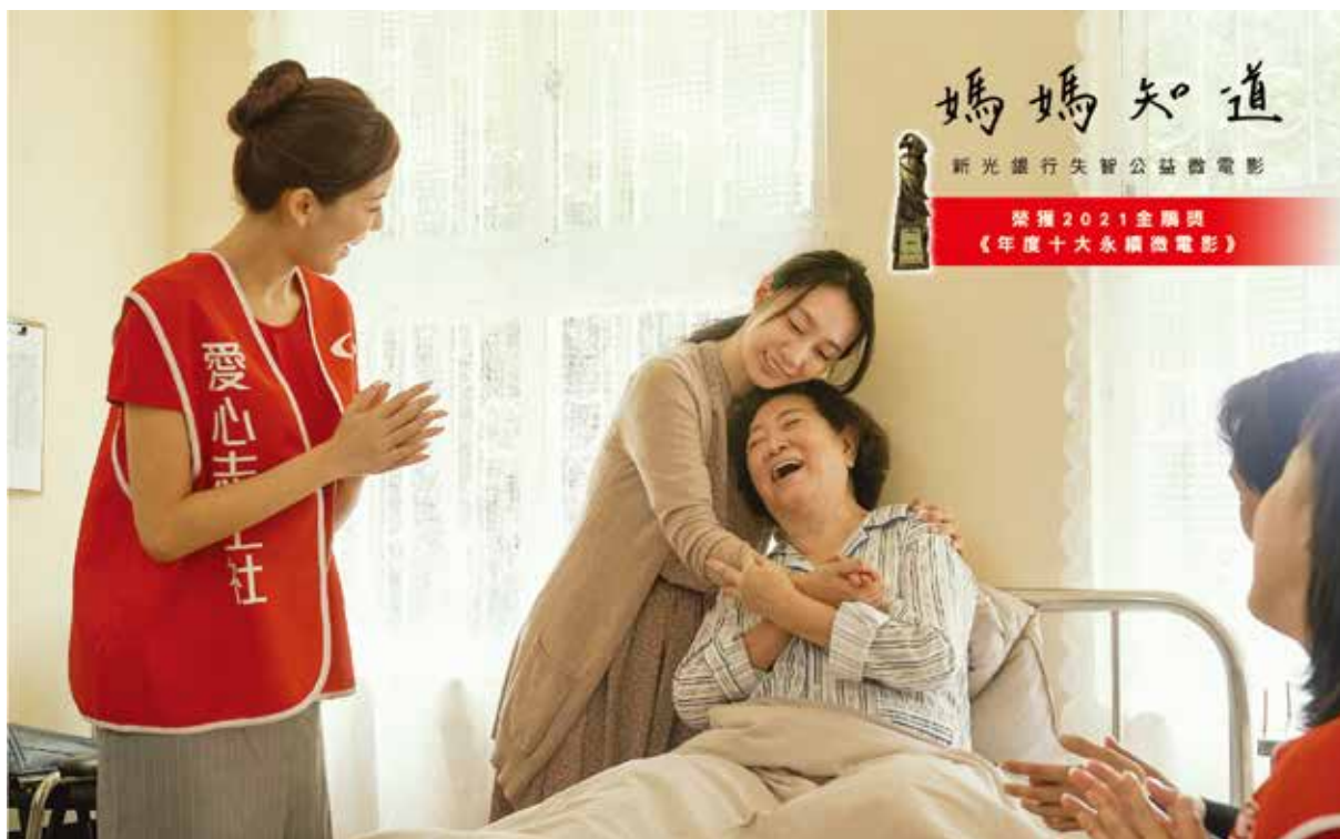
新光銀行善盡企業社會責任，推出公益微電影《媽媽知道》傳達失智友善之理念。