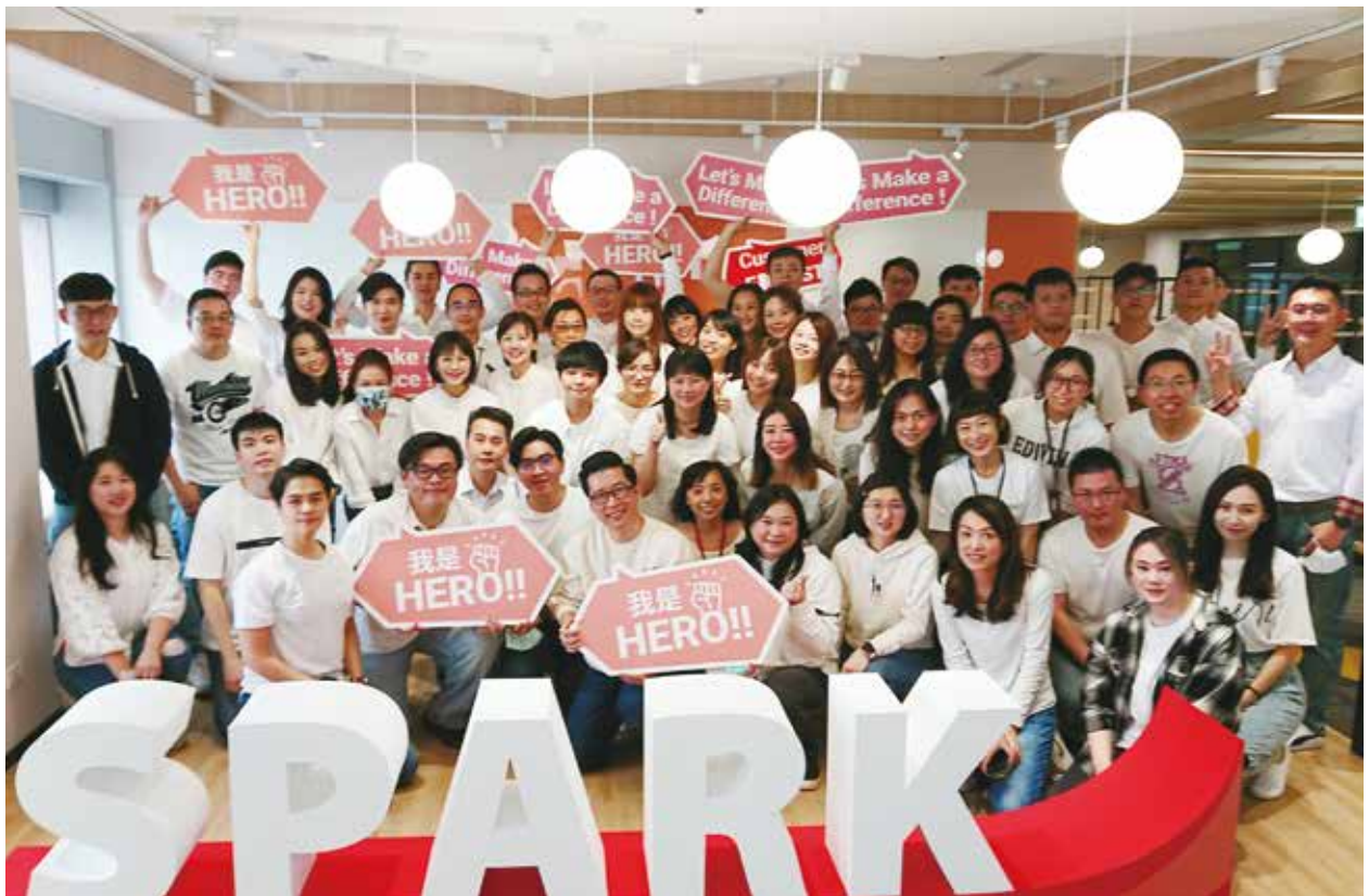
SPARK Heroes 於 SPARK Hub 相見歡，培養默契為打造 SPARK DNA 做好準備。