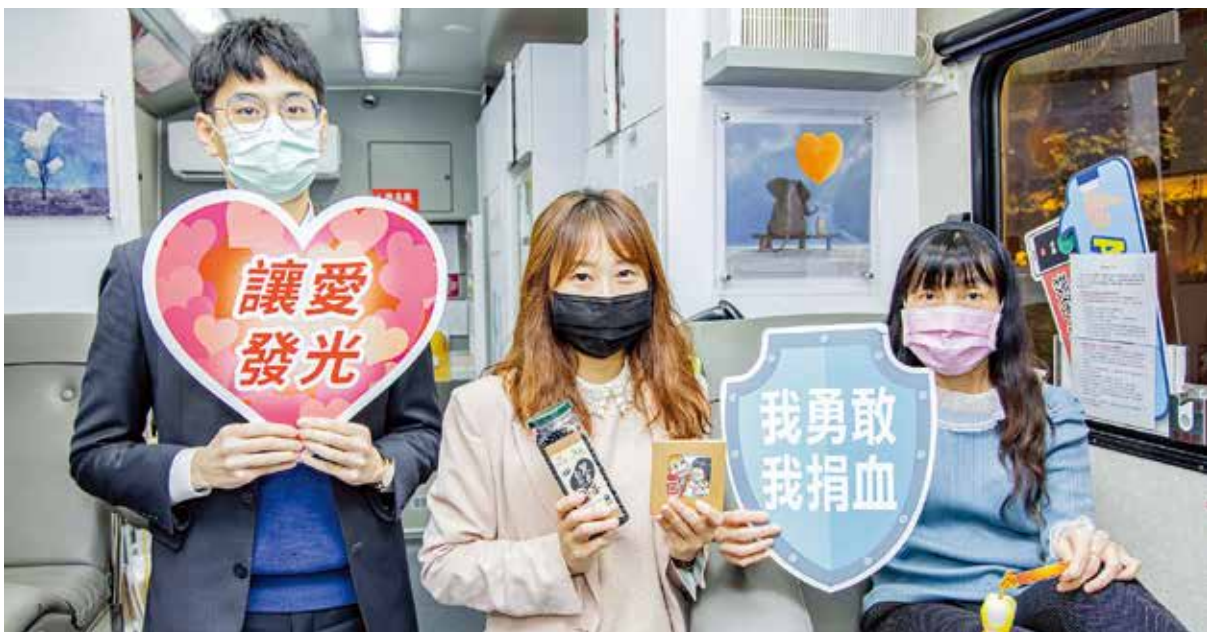
全台血液庫存量拉警報，新光人壽舉辦全國捐血活動邀民眾熱血挽袖。

新光人壽積極落實 ESG，善盡企業社會責任，2009年主動推出全國捐血活動，鼓勵民眾挽袖捐血，至今邁入第13年，新光人壽摩天大樓廣場自2003年起免費提供捐血車停放，長期投入募血行動的成果，總共募集超過66萬袋熱血，給予社會最及時、最需要的幫助。近年新光捐血活動贈品皆支持台灣在地農產品，2017年起更舉辦「新光小農市集」，邀集全台投入友善農業的年輕小農，免費提供場地、棚架、電力，所得全數歸於農友，呼籲民眾重視食安同時關懷環境永續，徹底展現「光無所不在，心與你同在」的企業精神。