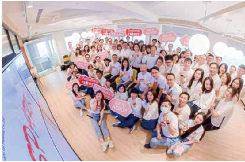
SPARK Heroes 英雄人才培育計畫正式啟動。

新光金控 FinTech 中心 — SPARK Hub 於 2021 年 3 月 2 日在站前摩天大樓 39 樓正式營運，SPARK 為新光 SK 的內涵展開，期待在轉型的過程可以帶來更多創意火花、閃耀我們的客戶及員工，帶來「新」火相傳的價值。SPARK Hub 期許成為新光金控金融科技創意的孵化中心，從金控層級的