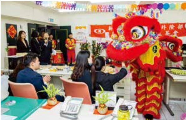
舞獅表演祥獅獻瑞，為新高通訊處帶來滿滿的好彩頭。