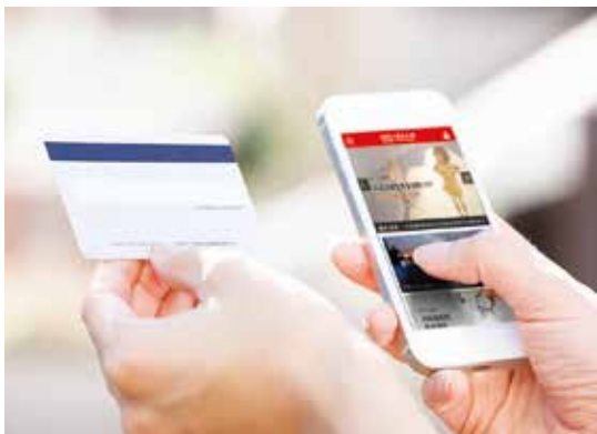
網路投保利率變動型年金保險，提早規劃理財及退休準備，還可抽高級智慧家電組。

給付年金，讓消費者可以依照自己的收支靈活配置，還可刷信用卡輕鬆繳費，搭配各家銀行現金回饋方案，長期累積下來，也能省下一筆可觀的費用。