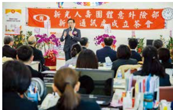
冷傳強處長希望同仁能時時刻刻保有服務熱忱，也期許單位能創下超越年度目標的業績。