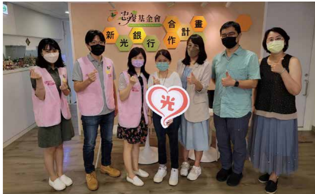
新光銀行及翻轉銀行財商教育平台與忠義基金會合作成立「忠義銀行」。

新光銀行及翻轉銀行財商教育平台長期關注及投入弱勢、偏鄉兒童教育，觀察到台灣弱勢學童往往因缺乏正確金融知識，導致產生錯誤金錢觀念影響未來發展，希望讓理財教育不再限於書本及課堂上教導，而是透過有趣及實作活動，讓弱勢兒童更貼近金融、擁有正確的金錢觀念，藉此幫助其利用平日所學知識逆轉人生。