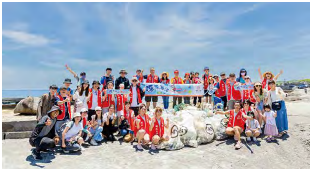
新光人壽號召員工、保戶共同前往貢寮區一起淨灘，樂天女孩主動響應加入，為守護海岸環境貢獻一份力量。

出，淡水河每年約有 1.47 萬公噸垃圾與塑膠微粒流向大海，造成生態嚴重污染。2022 新光人壽全國健行活動響應天下雜誌「淡水河公約」，動員鄰近淡水河的建國、松信、士林、北投及大文等五個業務單位，組成健走志工隊，於淡水河流域進行淨灘、淨河