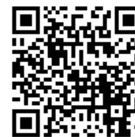
【開箱影片】樂天女孩參與新光人壽健行淨灘暨食農體驗活動

系，以確保生物多樣性並防止海洋環境劣化」目標，落實土地教育並建立安全健康的飲食觀念。