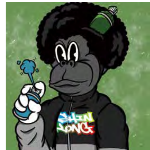
新光盃推出街舞圈第一個公益 NFT，初賽第二天即全部完售。

教學資源，持有者還可享免費舞蹈課程、知名街舞服飾品牌優惠及街舞圈最新資訊；新光也會聘請專業師資前進校園免費教授街舞課程，並與公益團體合作深入偏鄉，提供弱勢青少年學習專業街舞與表演的機會，讓更多潛力青少年也能有追求夢想的機會，促使街舞文化在國內持續深耕茁壯。