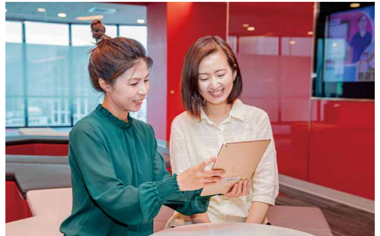
新光人壽爲首家壽險業導入「個人化資料自主運用 MyData」，提供顧客便利的金融服務體驗。

開創提供保戶不受時間與地點限制的便利服務，包括網路投保、視訊投保、簡化各項保全或理賠作業的申請流程，開辦保險金抵繳醫療費用服務、開發核保風險模型、理賠「好人、壞人模型」、與壽險公會及保險業者共同推動「保險業保全/理賠聯盟鏈」，加入「保險理賠醫起通」，以及使用LINE官方帳號進行理賠進度通知等多項服務，重塑全新保險業營運模式，提升數位服務快捷性與理賠程序便利性。