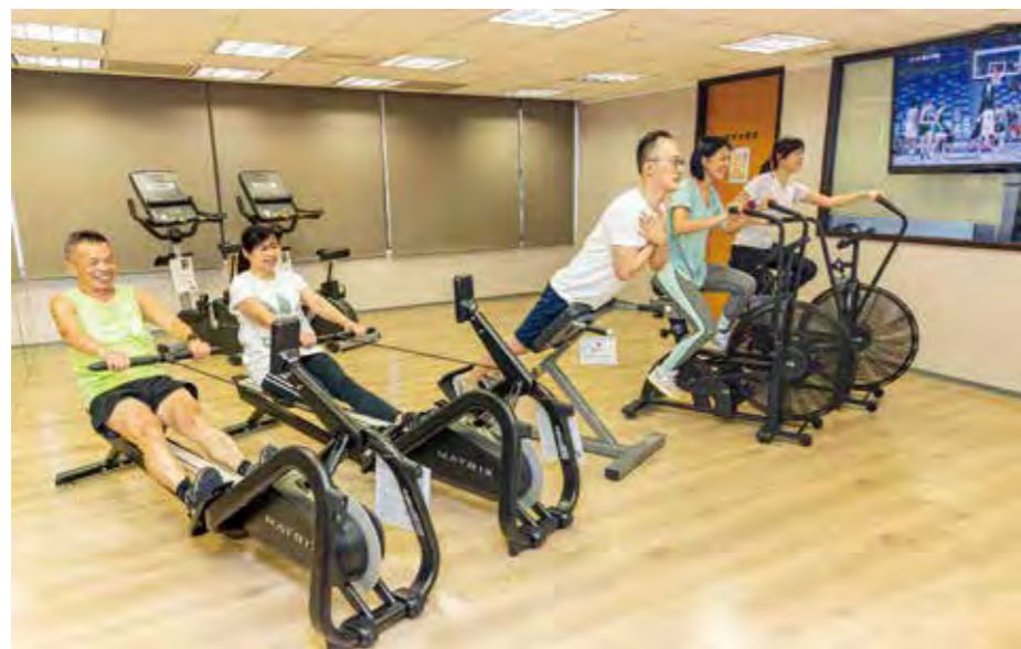
新壽推動職場健康，提供軟硬體健康設備及透過減重競賽，鼓勵員工養成運動習慣與維持健康體位，並配有健身教練駐點指導。

新光人壽積極推動職場健康與國人運動風氣，近年來深獲各界肯定與認同。連續兩年（2020、2021）獲得《康健》雜誌所舉辦的「CHR 健康企業公民」分別榮獲 5,000 人以上企業組「銀獎」、「銅獎」殊榮。此外，亦自 2016 起至今均取得「運動企業認證」標章，彰顯新壽推動全民健康不餘遺力。新光人壽表示，促進國人健康，相對就會減少就醫機會，避免醫療資源的浪費，維護健保永續經營與地球永續，未來，我們將繼續不忘初衷的努力推行員工健康，落實幸福企業理念，並協助推廣國人重視康，持續成為保險業中安全健康的標竿企業。