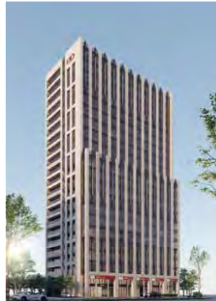
新南東大樓完工示意圖。

態永續概念，並達到綠建築銀級標章、智慧建築銀級標章及耐震標章等認證標準，減少建築能源耗用，實踐低碳健康生活，且為銜接後疫情時代生活，空調設備配合新鮮空氣交換調節，達到有效避免室內空氣交叉感染，整體設計展現綠色低碳城市新風貌，朝永續經營願景邁進。