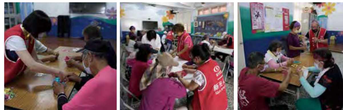
新光人壽員工陪伴銀髮長者摺製紙藝品，希望藉由手工藝創作訓練手眼協調及大腦等器官的活絡，促進長者身體健康。

據點遍部全台，始終以「在地的新光，道地的服務」的精神理念回饋社會，長年支持澎湖國際海上花火節、台中大甲媽祖遶境進香、台南鹽水蜂炮、南投日月潭泳渡、彰化田中馬拉松、嘉義國際管樂節等地方特色活動，期望藉此能促進在地經濟發展並凝聚社區意識，未來新光人壽將持續以各種方式回饋地方，創造社會共好，永續社會發展。