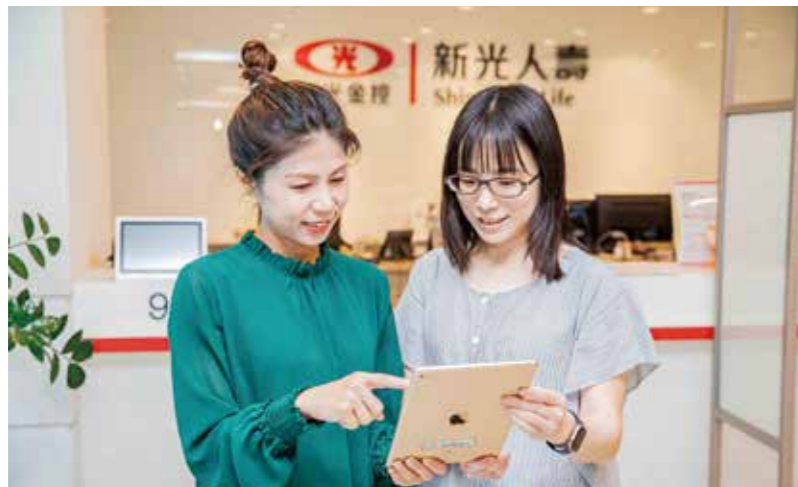
新壽導入「智能保單健診系統」，協助業務員更精準盤點保戶需要的保障缺口。

新光人壽明年即將迎接60週年，累積有效契約超過900萬件，秉持「新光一甲子，守護一輩子」的承諾，做全民的保障守門員，用心守護每一位保戶，全新智能保單健診系統預計於7月正式上線，配合業務員全面啟動，透過拜訪協助保戶檢視保險缺口，建構完善保障，爲台灣社會提供保險安定力量，也爲企業永續經營奠定穩定根基。