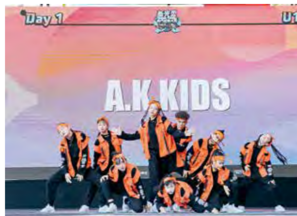
新光盃街舞大賽初賽熱烈展開，各年齡層的選手們彼此登台較勁。