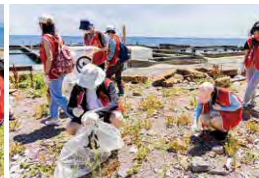
新光人壽全國健行活動響應「新光一畝田幸福餐桌」專案，除了淨灘公益活動，企業志工也攜家帶眷，帶著長輩、小孩們一同參與食農教育體驗，實踐全齡土地教育及健康飲食觀念。