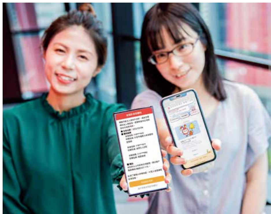
新壽運用「LINE 通知型訊息」，推出「新契約核保通知」，讓保戶即時掌握投保進度。

新光人壽為鼓勵保戶加入網路會員並使用便捷自主服務，特別推出「幣倍市集登入 LINE 抽點」活動，即日起至 9 月 30 日止，保戶「登入新光人壽網路會員專區」即可輕鬆獲得抽獎資格，最大獎 LINE POINTS 1000 點等你拿！