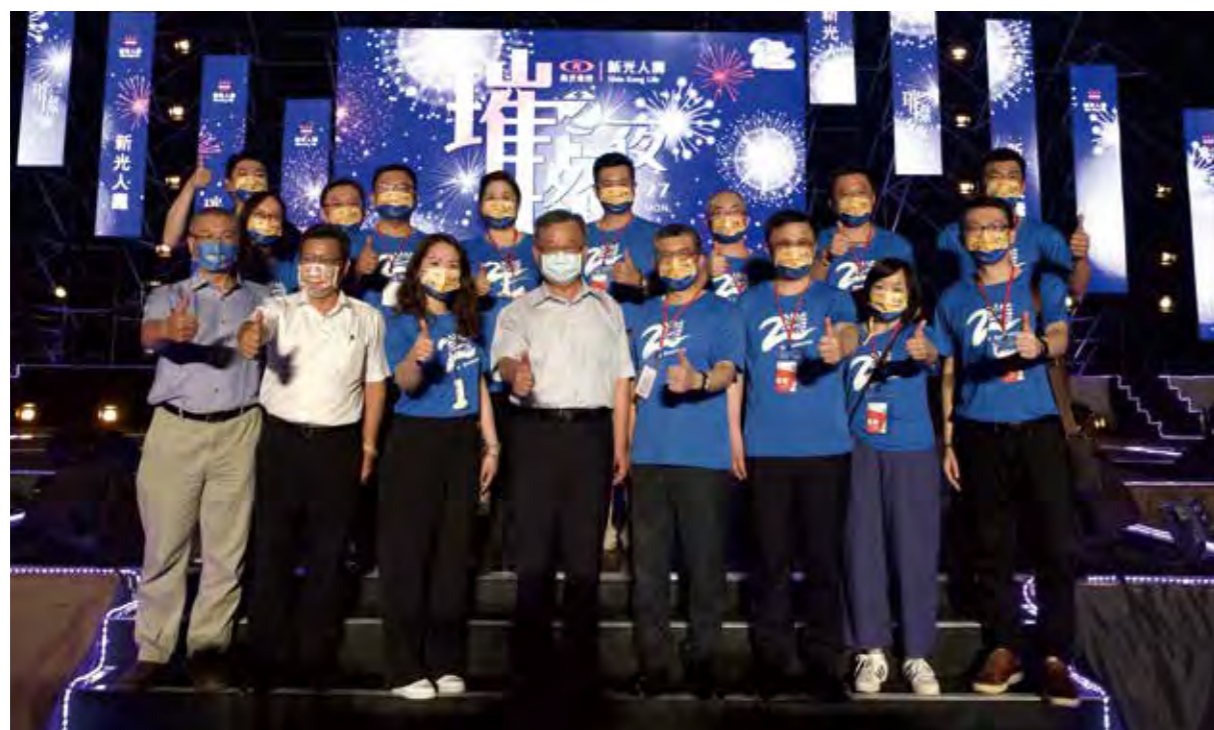
(左 4 起) 澎湖縣縣長賴峰偉與新光人壽總經理黃敏義、副總經理溫英宗與新壽同仁共同出席澎湖花火節「新光人壽之夜」，以實際行動支持澎湖觀光發展。

新冠肺炎疫情衝擊觀光產業，新光人壽力挺國內旅遊，深耕澎湖，第九年持續參與澎湖國際花火節活動，並於 6 月 27 日舉行企業主題場「新光人壽之夜」活動，新光人壽總