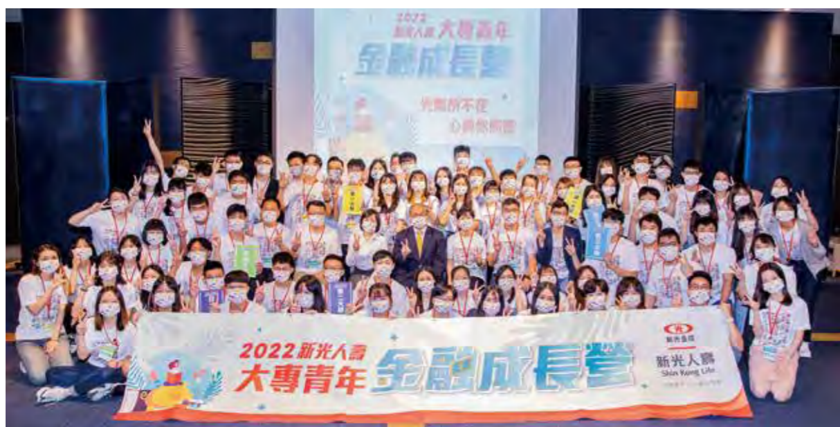
新光人壽舉辦為期四天的「2022 新光大專青年金融成長營」，協助學子厚植職場軟實力。

生，畢業超過一年仍未就業的人達22%，就算就業也有約1成的人是在打工；薪資則以金融及保險業4萬7307元均薪為最高。為協助學子在升學就業或是職能探索方面，都能及早掌握方向，本次營隊規劃設計多元豐富課程內容，包括新光金控及新光人壽高階主管傾