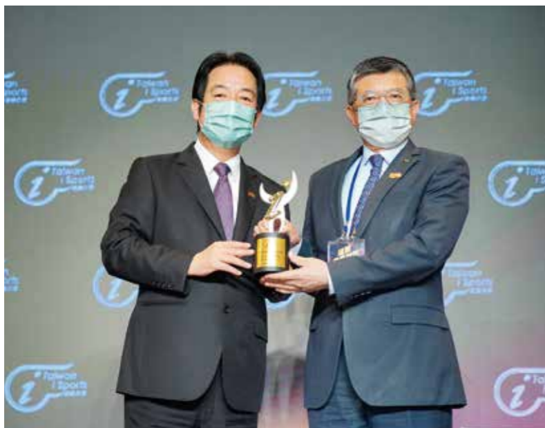
新光人壽推動全民健康不遺餘力，連四度獲「運動企業認證標章」，由副總統賴清德（左）授證，新光人壽總經理黃敏義（右）代表接受。

養成員工運動習慣外，在公司大樓內，規劃「樂笑健身區」，提供多樣性健身器材，並配有健身教練駐點指導，幫助員工在運動的時候可以在旁邊透過專業的角度指導，調整運動的姿勢，避免一些不必要的傷害；設置「旗艦型新光 i 健康量測小站」並結合 APP 使員工能快速了解自己的健康狀態，以達到自主管理健康。每年舉辦減重活動，透過競賽與高額獎金激勵員工動起來，減重活動開辦至今，參與員工「降肉」高達 5,734 公斤，藉此養成運動習慣與維持健康體位。