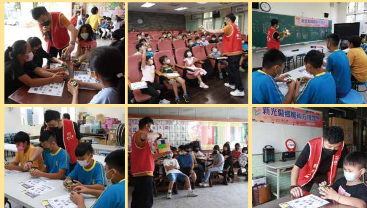
新光人壽前進多所偏遠地區國小推廣魔術方塊，讓孩子感受魔術方塊的魅力。

新光人壽長期舉辦魔術方塊競賽，發現魔術方塊在國內外不但擁有高人氣，還有一群資深玩家拍攝教學影片及自辦比賽，默默推動台灣魔術方塊發展，也因此連續 5 年贊助「台灣魔術方塊錦標賽」，希望透過企業的支持，讓魔方愛好者有挑戰自我、探索興趣的舞台。