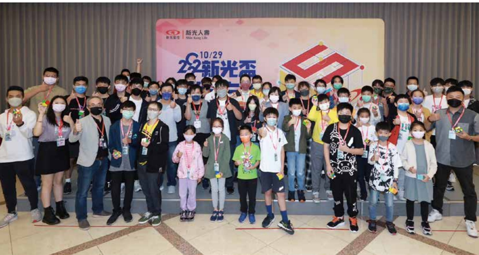
2022「新光盃魔術方塊大賽」參賽者年齡橫跨少年、青壯世代，長幼齊聚拚搏鬥智。

魔術方塊被視為世界三大智力遊戲之一，對於小朋友的邏輯思考及腦力發展有絕對的助益，即使至今 3C 產品當道，在全球依舊擁有許多忠實玩家。新光人壽為提供一個讓玩家腦力激盪，良性競爭的平台，於 10 月 29 日舉辦「2022 新光盃魔術方塊大賽」，吸引各路高手角逐爭冠，參賽者中不乏國手及台灣紀錄保持者；此外，更首度走進偏鄉進行魔術方塊教學推廣，讓孩子感受魔術方塊的魅力，「轉」出成長新契機。