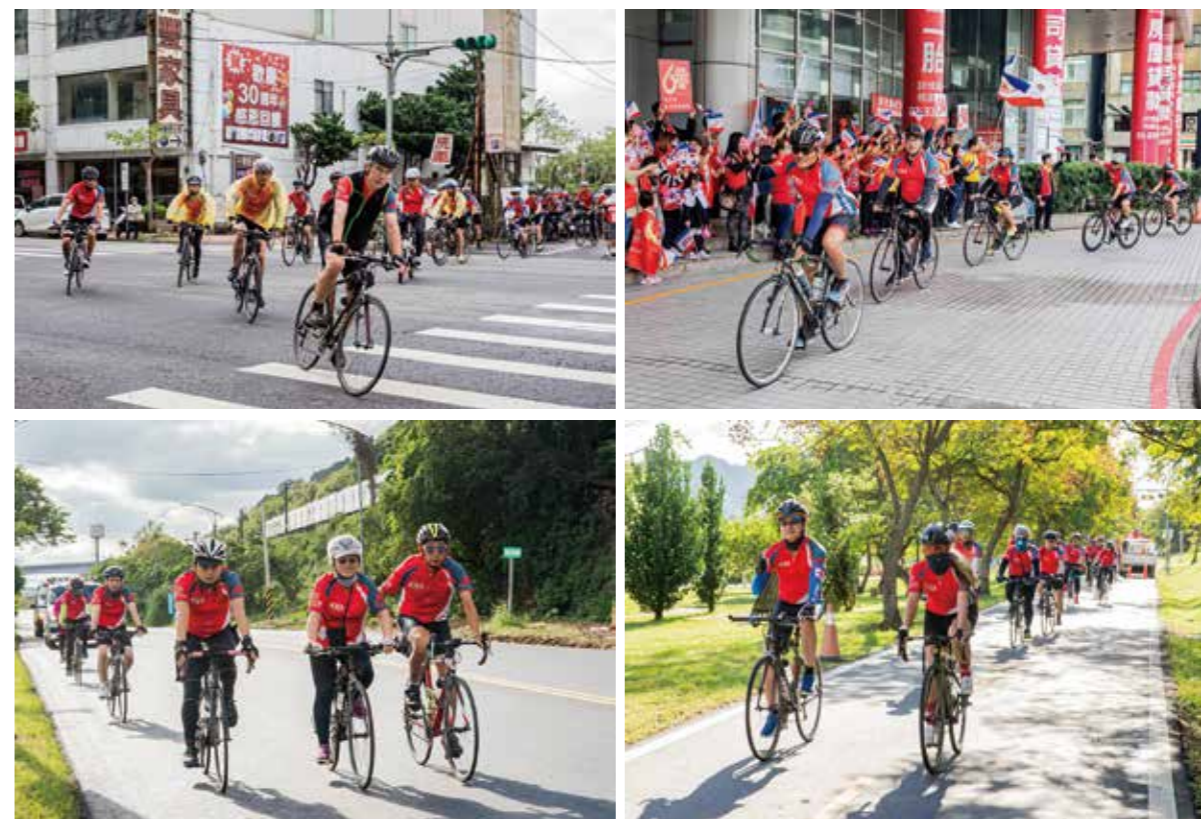
新光騎士們一路破風前行，沿途行經多個新光人壽大樓，也有許多業務單位同仁組成加油團搖旗吶喊，為騎士加油打氣。