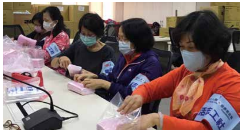
協助醫師公會包裝發放口罩

樂活志工社 http://www.skf.org.tw/SKVolunteer.html