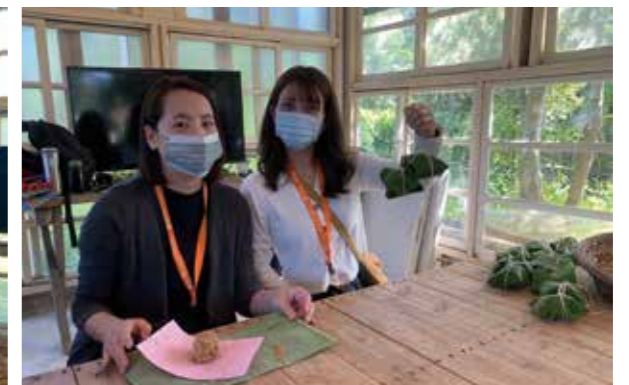
大家分工合作將鹹鴨蛋包進剛摘下的芭蕉葉裡，綁得像粽子一樣，期待一個月後的成品。