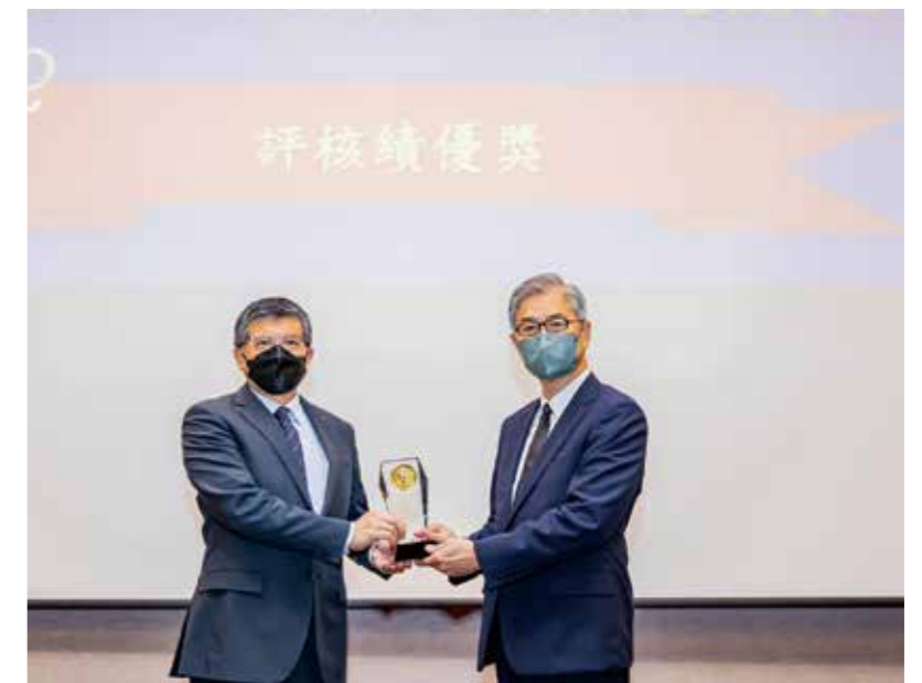
新壽落實公平待客，獲金管會評核為 111 年度績優金融機構，由金管會主委黃天牧（右）頒獎予新光人壽總經理黃敏義（左）。

在商品面，新壽將 ESG 議題納入開發考量，建立包容性商品量測機制，規劃符合特定客群需求的保險。為鼓勵國人維持健康，強化健康風險管理能力，同時響應聯合國永續發展目標 SDGs 3：確保及促進各年齡層健康生活與福祉，積極推廣外溢保單。重視金融弱勢族群基本保障需求，規劃「小額終老保險」及「微型保險」等商品，並與社福團體、縣市政府社會局等機構團體合作，提供微型保險保費贊助，開辦至今提供超過 23 萬人次、累計保費 4800 萬元的保障。