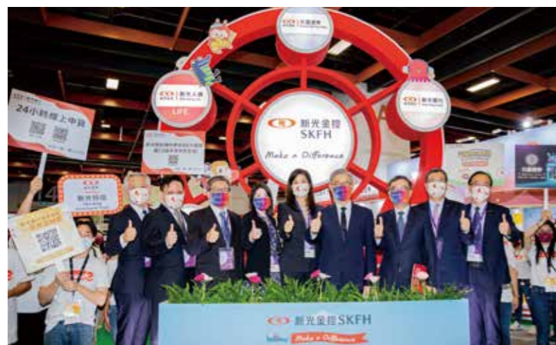
2022 台北金融科技展 28 日開幕，金管會主委黃天牧（右 5）蒞臨新光金控「Digital Park 數位樂園」參訪與新光金控總經理吳欣儒（右 6）合照留影。

2023 年新光即將邁入 60 周年，新光金控與旗下子公司將持續推動數位轉型，展現帶給客戶最佳體驗的決心，秉持「低碳、創新、共好」的價值型金融理念，提供最便利的無紙化與自動化服務，實現數位綠色金融生活願景。