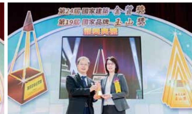
新光人壽以「小保費換大保障」為理念設計「我的好時光保險計畫」，獲國家品牌玉山獎「最佳產品獎」全國首獎，由國發會主委龔明鑫頒獎(左)、新光人壽陳欣怡協理代表領獎(右)。