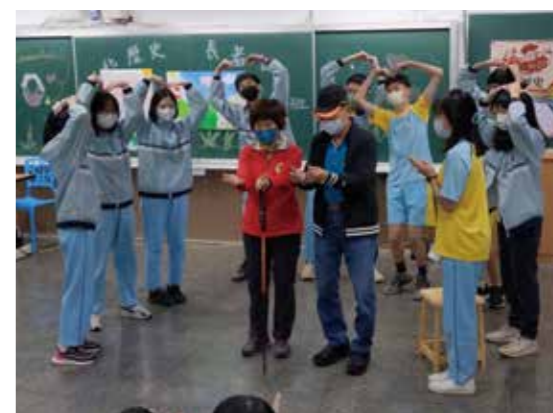
學生們與爺爺奶奶溫馨互動，激發跨世代的火花與情誼。

動，用問問題、手繪海報、一起演戲等方式互動，過程中激發出跨世代之間的火花與情誼，一位女同學覺得：「這堂課很有價值，可以知道以前的事情，跟其他課很不一樣、很好。」最後由學生拉奏中提琴表演給爺爺、奶奶欣賞，一曲「望春風」溫柔的琴音流動，引起了長者的共鳴，跟著哼唱起來，帶領講師也即興邀請一位失智奶奶上台演唱，雖未經排練卻相當協調精彩，在溫馨動人的氣氛下，完成了一堂理解與接納的生命教育課。