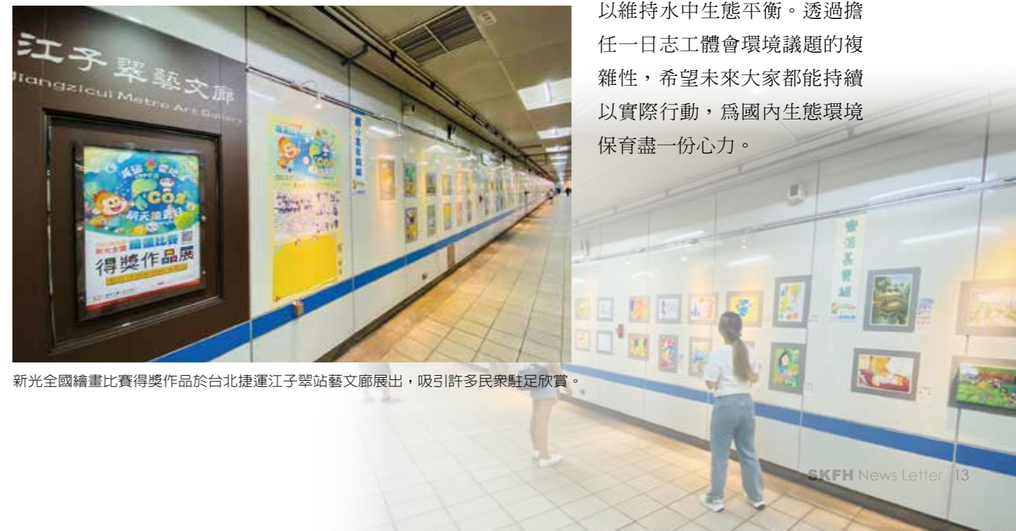
新光全國繪畫比賽得獎作品於台北捷運江子翠站藝文廊展出，吸引許多民眾駐足欣賞。

此外，為呼應今年繪畫比賽主題，新光也特別與台灣環境資訊協會合作，設計環境保護體驗活動，邀請得獎者及家長們於11月9日到國家級植物園研究及保種單位「台北植物園」進行外來種水芙蓉移除任務，以維持水中生態平衡。透過擔任一日志工體會環境議題的複雜性，希望未來大家都能持續以實際行動，為國內生態環境保育盡一份心力。