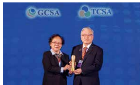
新光人壽榮獲兩項大獎，由金管會副主委蕭翠玲（左）頒發，新光人壽董事長潘柏錚（右）代表受獎。