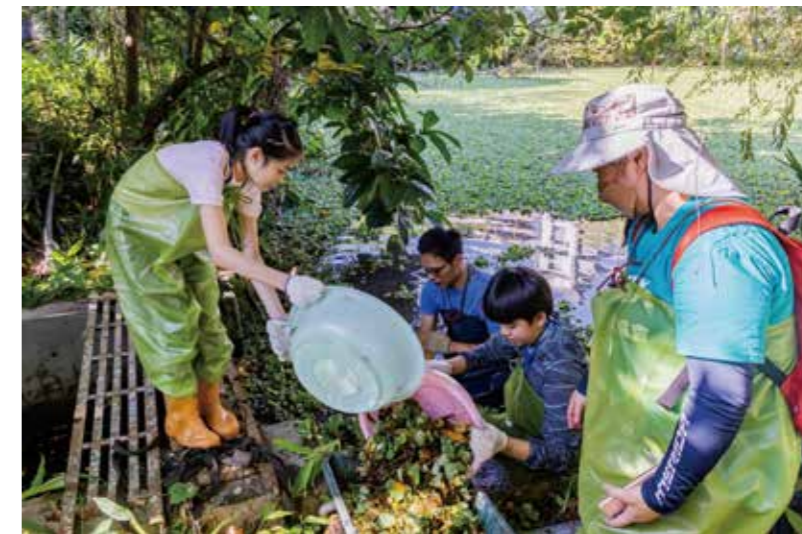
志工們穿上「青蛙裝」進入植物園荷花池，協助將水芙蓉打撈上岸，而水芙蓉經曝曬成乾葉後，也將做為綠肥使用，可達到資源循環、永續利用的目的。

可以透過線上投票給予參賽者支持與肯定，並欣賞到更多優秀作品。本次網路票選活動相當踴躍，吸引近6萬多名網友熱情關注，共計138,246次投票數，打破歷年「人氣票選」的參與人數。新光全國繪畫比賽開辦至今已十八屆，將持續以「光無所不在，心與你同在」