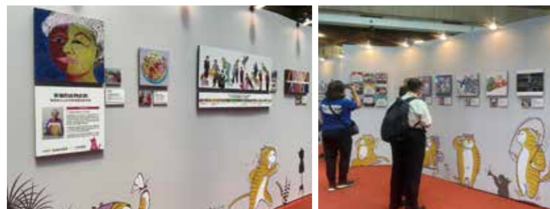
在「傳承藝術」生命故事創作展中，感受幸福就在此時此刻。

「幸福照顧服務館」集結了14個幸福照顧服務項目，其中包括新光人壽慈善基金會自2005年引進台灣，訴求以「用創意服務長者」的兩個藝術方案——「傳承藝術」與「活化歷史」。