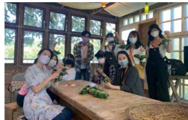
同仁拿著自己做的鹹鴨蛋開心大合照

色經濟，確保永續消費及生產模式」經過這次新光金控 x 島內散步永續旅遊活動 - 新竹峨眉舊城一日遊，走進新竹，揮別一般廟口吃小吃的旅遊行程，深入探索新竹的歷史文化並走進大自然，在遊玩的途中讓大家更能體會永續的意義與目標。