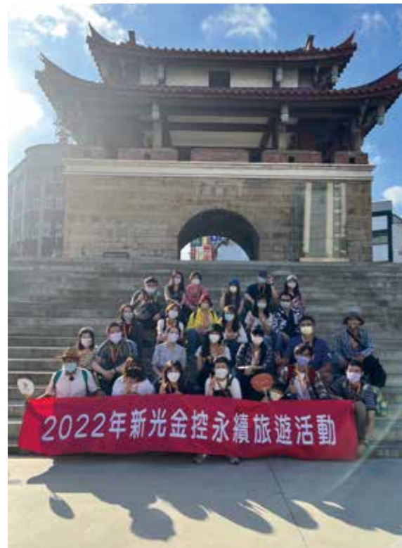
在具有濃厚歷史文化氣息的東門迎曦門前，留下紀念性的合照，而走進這個古蹟之都的同時，也達成了永續發展目標 (SDGs) 第 11 項永續城鄉。

們奔跑的同時，也是我們去鴨寮撿取鴨蛋的時候。回到室內教室，大家分工合作，先擦淨鴨蛋，將紅土與鹽巴充分混合後包覆在鴨蛋外層，裹上米糠，最後幫鴨蛋們穿上芭蕉葉，並綁實綁緊，在未來一個月，蛋黃能夠好好的脫水變成好吃的鹹蛋！透過無負擔農場的活動，除了讓我們放鬆身心，體驗DIY 做鹹蛋的樂趣，也讓我們體會到環境永續的重要性。