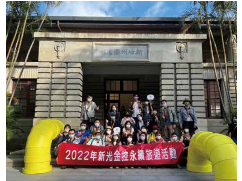
新竹州圖書館 - 「管 From Here To Anywhere」特展」近百歲的新竹州圖書館和當代藝術之結合。

下午來到新竹舊城區，這裡從清朝到日治時期是北台灣政治和經濟的重要標的，擁有豐富的古蹟與歷史。從東門迎曦門出發，沿著護城河，了解當時的歷史，途中經過新竹州圖書館，是全台第二座地方公共圖書館，1984年由新光人壽買下，並在1998年被指定為市定古蹟，透過原貌修復，盡可能保有當時工法，在新光人壽